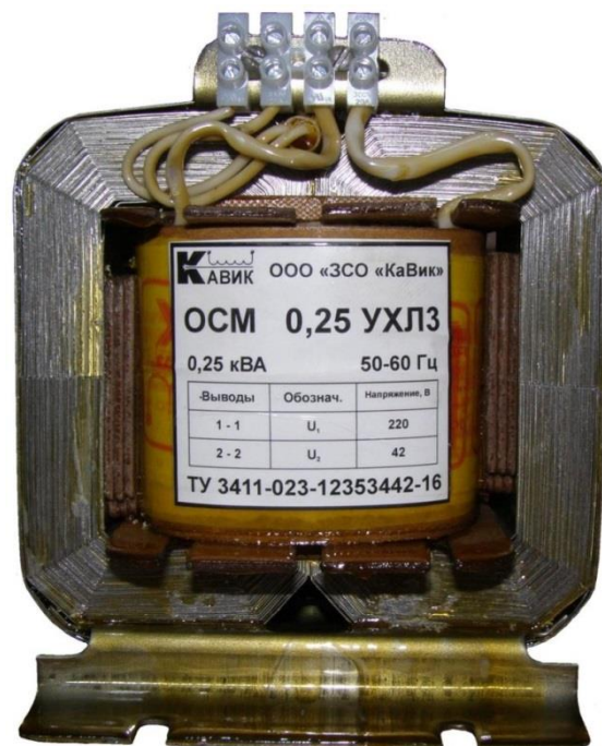
Рис. 1 Общий вид трансформатора.

1.9. Трансформаторы предназначены для монтажа в аппарате (устройстве), у которого защита от прикосновения, попадания воды и перегрузки осуществляется этим аппаратом (устройством).